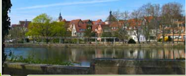
PANORAMABLICK BEI DER ALTEN ENZBRÜCKE